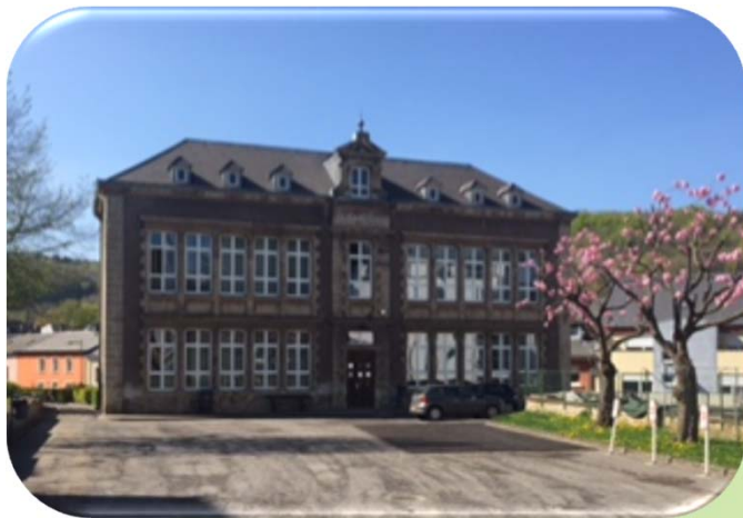
Ancienne École ménagère 2, rue de la Montagne L-4630 Differdange