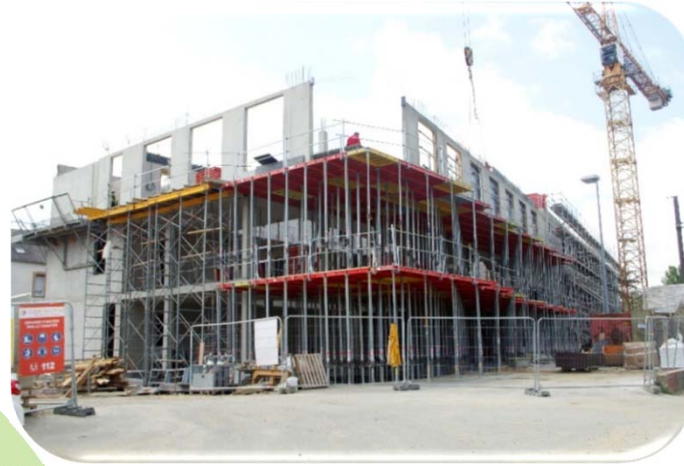
Campus de l'EIDE Adress to be defined

S1FR1, S1FR2, S1EN1, S2FR1, S2FR2, S2EN1, VP1+2, ACCU