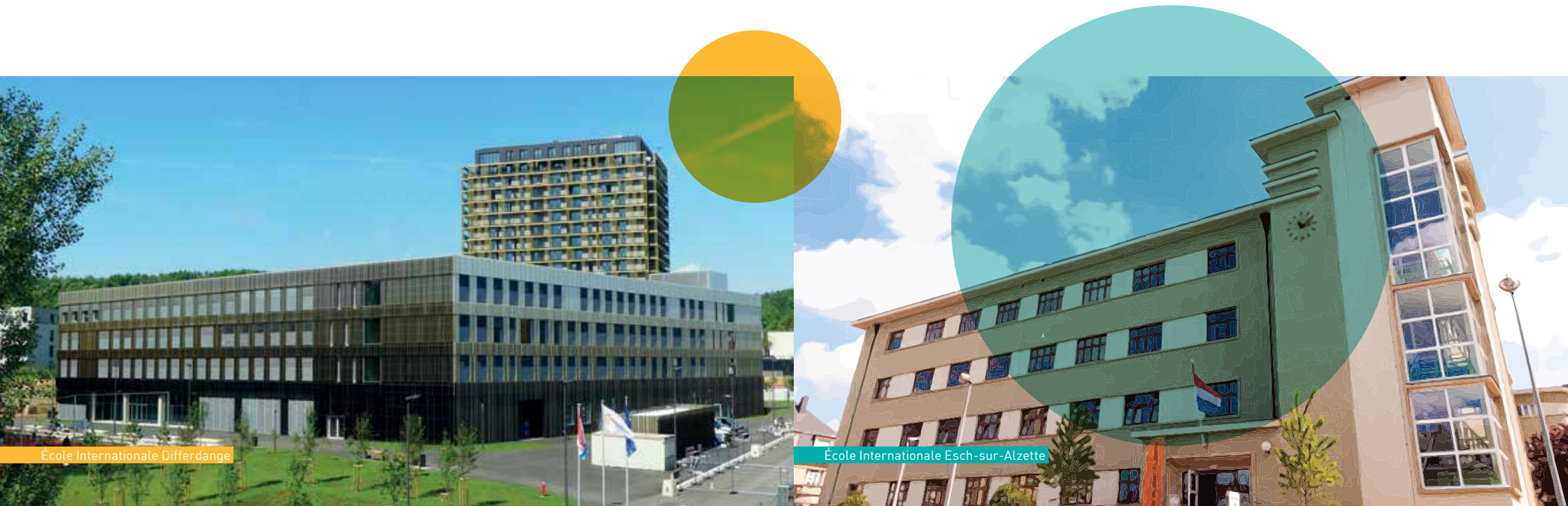
École Internationale Differdange